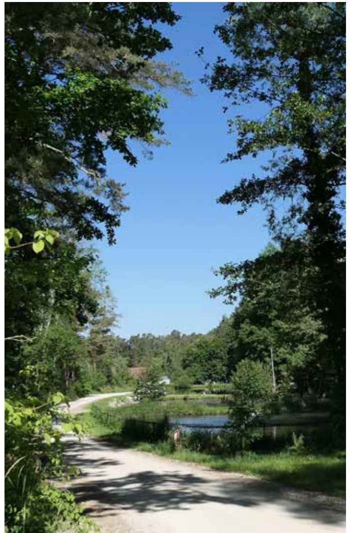
„Im Tal“: dieser Weg begleitet den Röttenbach auf seiner letzten Etappe – an den Fischweihern vorbei bis zur Mündung in die Schwäbische Rezat.