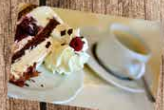
Kaffee & Kuchen

Das Dorfladen-Team freut sich auf euer Kommen!