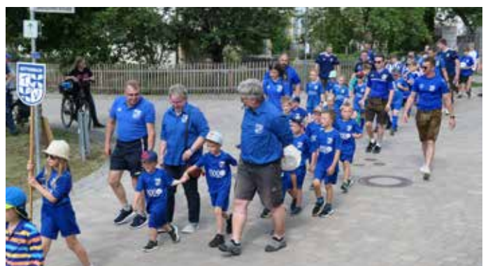
Oben links bis unten rechts: Gemeinderat, Rauchclub, Haus für Kinder, Rotes Kreuz, FCB-Fans, Sportschützen, TSV