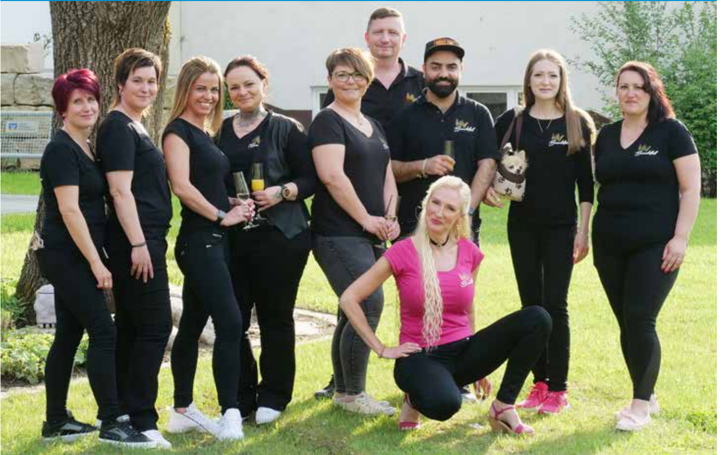
Das neue Team vom „Beautiful for Kings and Queens“ in Röttenbach